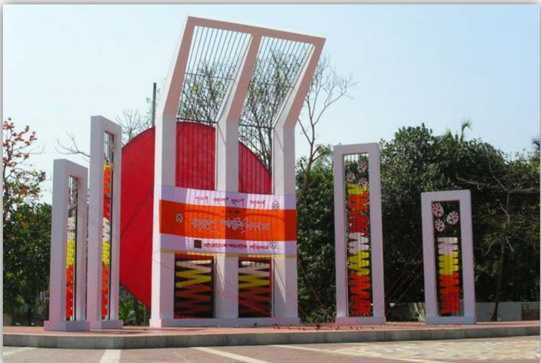
Пам'ятник жертвам боротьби за статус бенгальської мови, встановлений на території університету в Дацці.

Історія свята має трагічний початок. Дату 21 лютого вибрано тому, що саме цього дня 1952р. загинуло п'ятеро студентів, які брали участь у демонстрації за надання рідній їм бенгальській мові (в тодішньому Пакистані) статусу державної. Пізніше частина Пакистану стала незалежною державою Бангладеш.