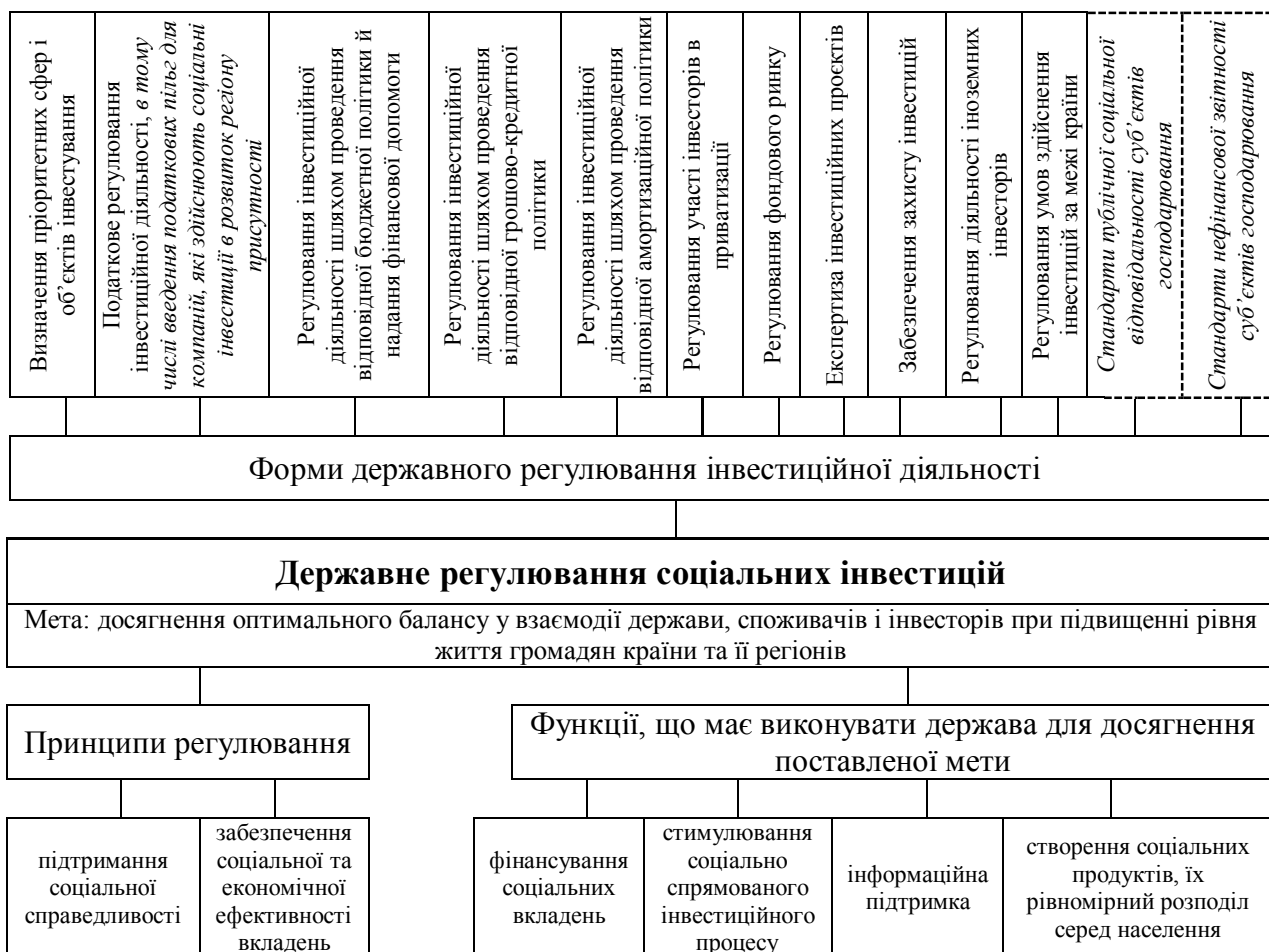
Рис. 5. Контент державного регулювання соціальних інвестицій

регіональному рівнях [4, с. 49]. Тому можливими напрямками прискорення процесу реалізації інвестицій в соціальну сферу є розробка законодавства, яке б визначало правові межі соціально-відповідальної поведінки суб'єктів господарювання, та удосконалення правових методів регулювання соціально-орієнтованої інвестиційної діяльності (рис. 5).