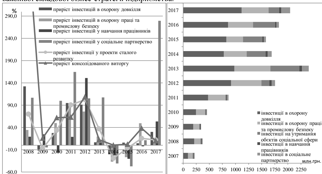
Рис. 4. Динаміка інвестицій у проекти сталого розвитку та консолідованого виrotу енергетичного холдингу ДТЕК у 2007—2017 рр.

На прикладі результатів аналізу інтегрованих звітів фінансових та нефінансових показників діяльності енергетичного холдингу ДТЕК у 2007—2017 рр. можна зробити висновок, що на вітчизняних підприємствах обсяги соціальних інвестицій поступово збільшуються, хоча дещо нерівномірними темпами (рис. 4). Однією з причин тому є відсутність планового характеру реалізації соціальних інвестицій та несприйняття їх як важливої складової бізнес-стратегії підприємства.