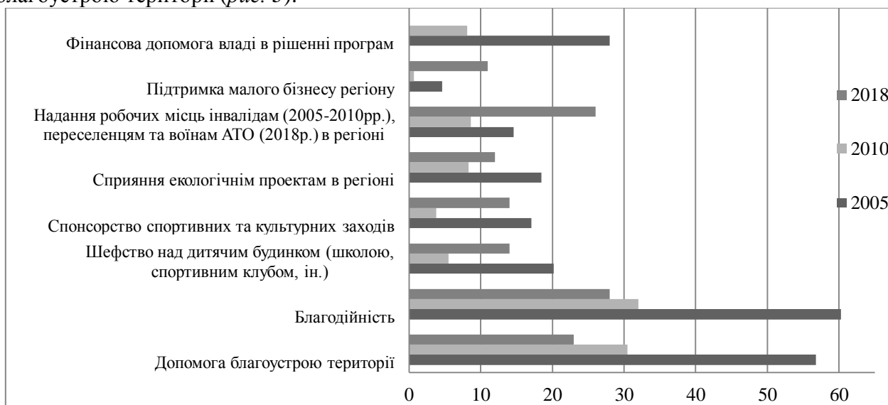
Рис. 3. Напрями соціальних інвестицій у розвиток регіонів України у 2005—2018 рр.

Фактична кількість українських компаній, які здійснювали соціальні інвестиції у розвиток регіону присутності у 2018 році становила 22%, що більше значення 2010 року на 5,6%. Водночас кожна п'ята компанія не допомагає розвитку регіону присутності, така ж частина планує це робити в майбутньому. Більшість опитаних українських компаній (70%) здійснювали соціальні інвестиції протягом 2015—2018 рр. При цьому розмір соціальних інвестицій збільшився лише у 27% компаній [4]. Найпоширенішими напрямками допомоги регіону присутності і громаді є виділення коштів на благодійність та допомога у благоустрою території (рис. 3).